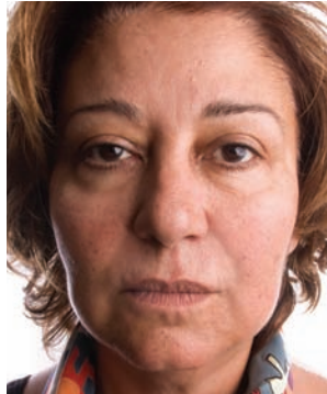
AFTER 8 SYRINGES *

* Patient also recieved IPL treatment for pigmentation